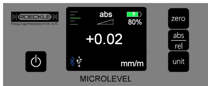
Farbdisplay mit übersichtlichen und logischen Bedienfunktionen